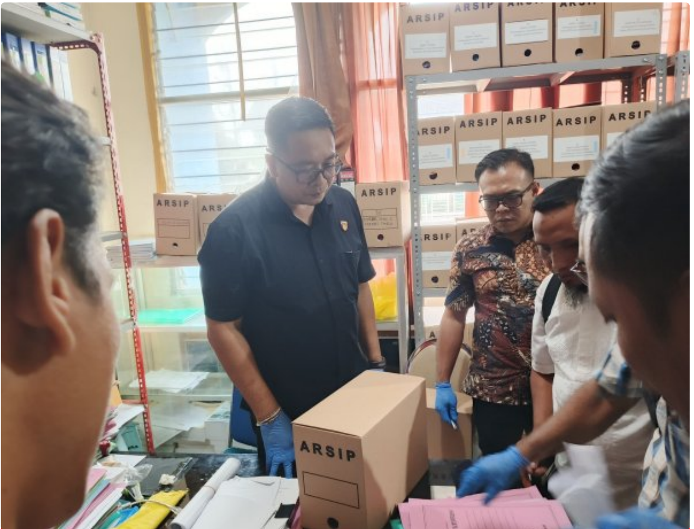
Saat Pengeledahan di Dikbud NTB, Jumat (13/12/2024)